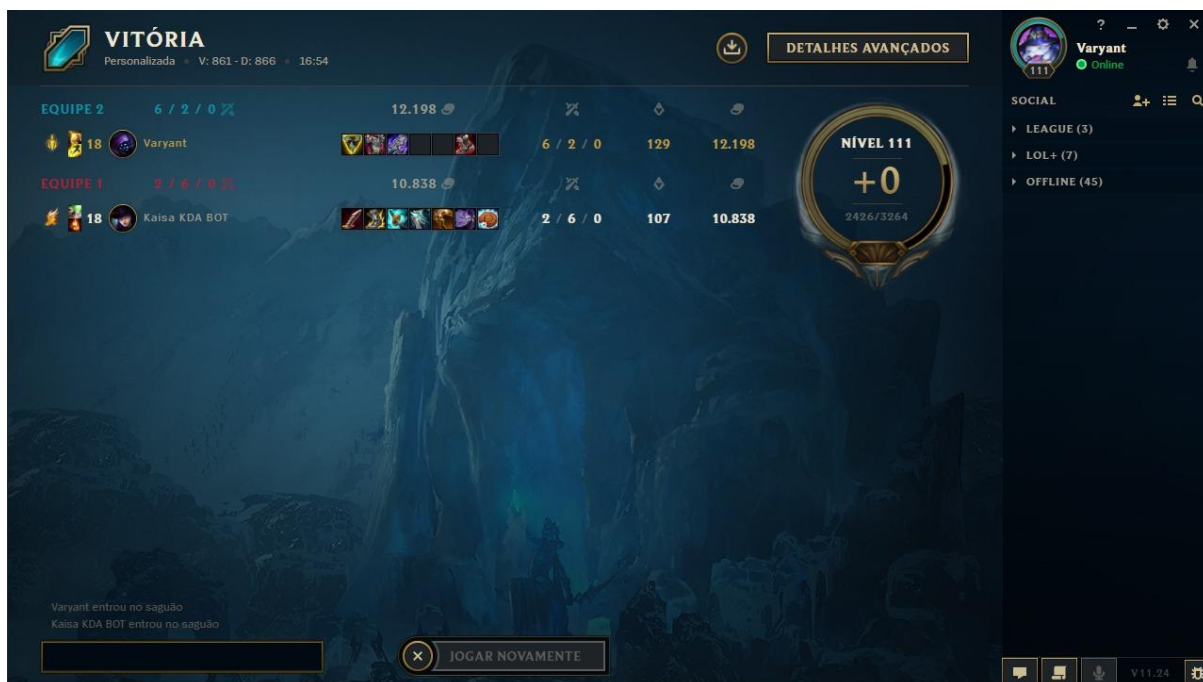
Tela de estatística exibida ao final da partida de League of Legends